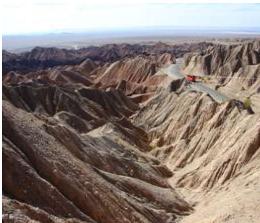
شکل ۷- نمایی از بدلندهای نهپندان در بیابان لوت

اهداف علمی سفر به رشته تحریر در آورده و ارائه نمایند. در طول سفر و در ایستگاه‌های مختلف، دانشجویان با رویکرد کاوشگری، ضمن مشاهده دقیق و تمرکز بر ابعاد مختلف پدیده‌ها نسبت به جمع‌آوری اطلاعات و شواهد اقدام و همراه با دقت در توضیحات استادان با یادداشت برداری، تهیه فیلم و عکس با فرصت مناسب برای تحلیل ابعاد مختلف مفاهیم مورد مشاهده در جمع‌بندی‌های روزانه فراهم آورند.