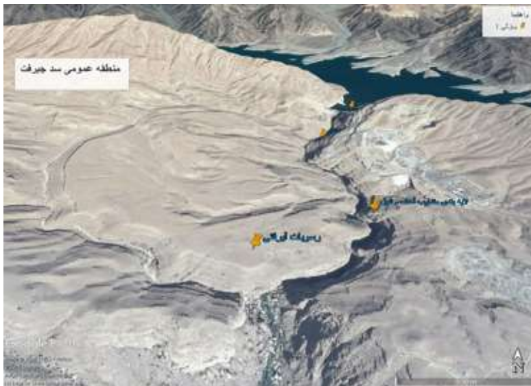
شکل ۶ - تصویر ماهواره‌ای و شبیه‌سازی مکان‌های مورد بازدید در منطقه عمومی سد جیرفت در جلسات توجیهی قبل از سفر، ضمن توضیح در مورد چگونگی نگارش گزارش علمی، دانشجویان مکلف شدند گزارش کامل و مصور توصیفی-تحلیلی خود را از مشاهدات و