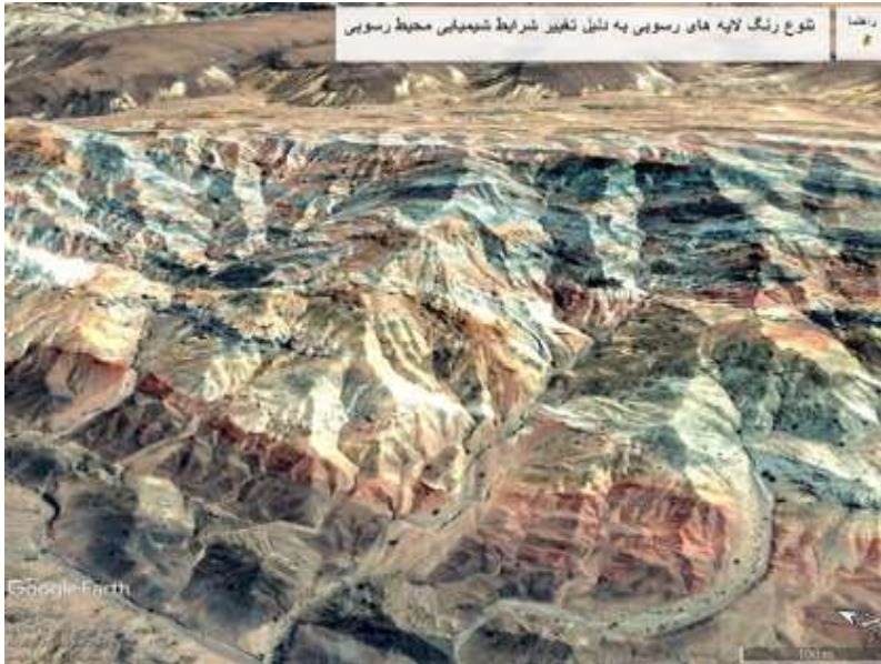
شکل ۵ - تصاویر ماهواره‌ای از تپه‌های رنگی مریخی در ۱۰ کیلومتری شهرنهبندان