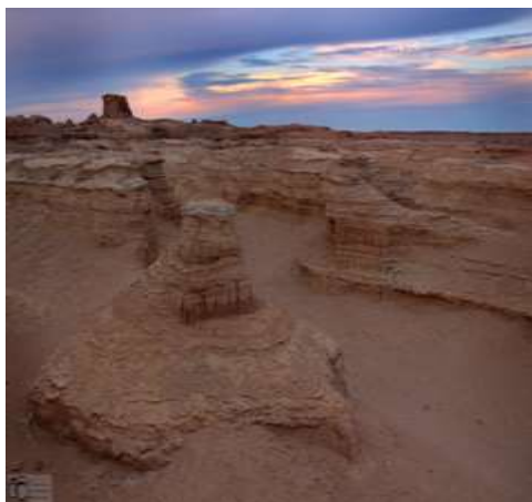
شکل ۸- کلوتهای بیابان لوت در نزدیکی شهداد

مشارکت فعال و علاقمندی اکثر دانشجویان در فعالیت میدانی، همراهی و مشارکت استادان محترم در مباحث و ایجاد زوایای جدید و نگرش تلفیقی و