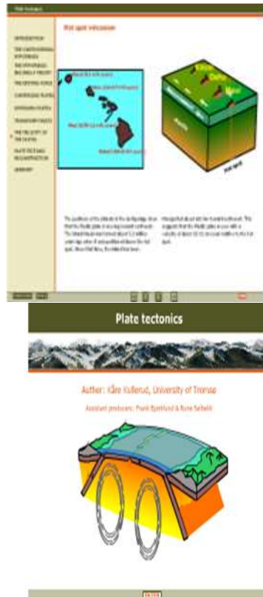
شکل ۱ - تکتونیک صفحه‌ای و نقش آن در ایجاد اشکال سطح زمین

۴- جاذبه‌های بصری تصاویر و انیمیشن‌های آموزشی، تنوع محتوای علمی نرم افزارهای فوق‌الذکر، فرصت‌های درگیرکننده کاوش در وب و یادگیری چندسطحی و اقتضایی ناشی از آن موقعیت‌های مناسبی برای یادگیری را فراهم می‌نمود (نمونه‌ای از تصاویر انیمیشن‌ها در شکل‌های ۱، ۲ و ۳ قابل مشاهده است).