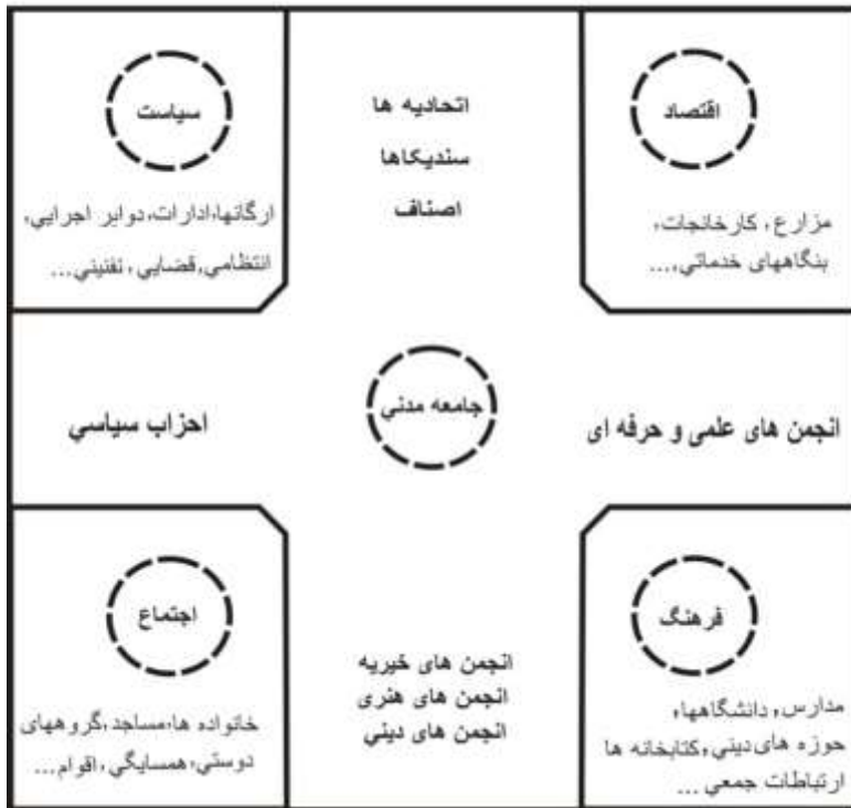
شکل شماره ۱؛ جامعه مدنی به عنوان منطقه حائل بین چهار بخش اصلی جامعه. منبع: (چلبی، ۱۳۹۵: ۲۸۹)

خودجوش، مستقل و داوطلبانه است (میرزایی، ۱۳۹۶: ۲۹)، یا جامعه مدنی شکلی از روابط اجتماعی است که گروه‌های محوری جمعی (حائل) آن را انجمن‌های داوطلبانه تشکیل می‌دهند و روابط میان آن‌ها نیز از جنس روابط انجمنی ۱ است (چلبی، ۱۳۹۴: ۱۱۴). جامعه مدنی به عنوان منطقه حائل بین چهار بخش اصلی جامعه (سیاست، اقتصاد، فرهنگ و اجتماع) قرار می‌گیرد. شکل شماره (۱):