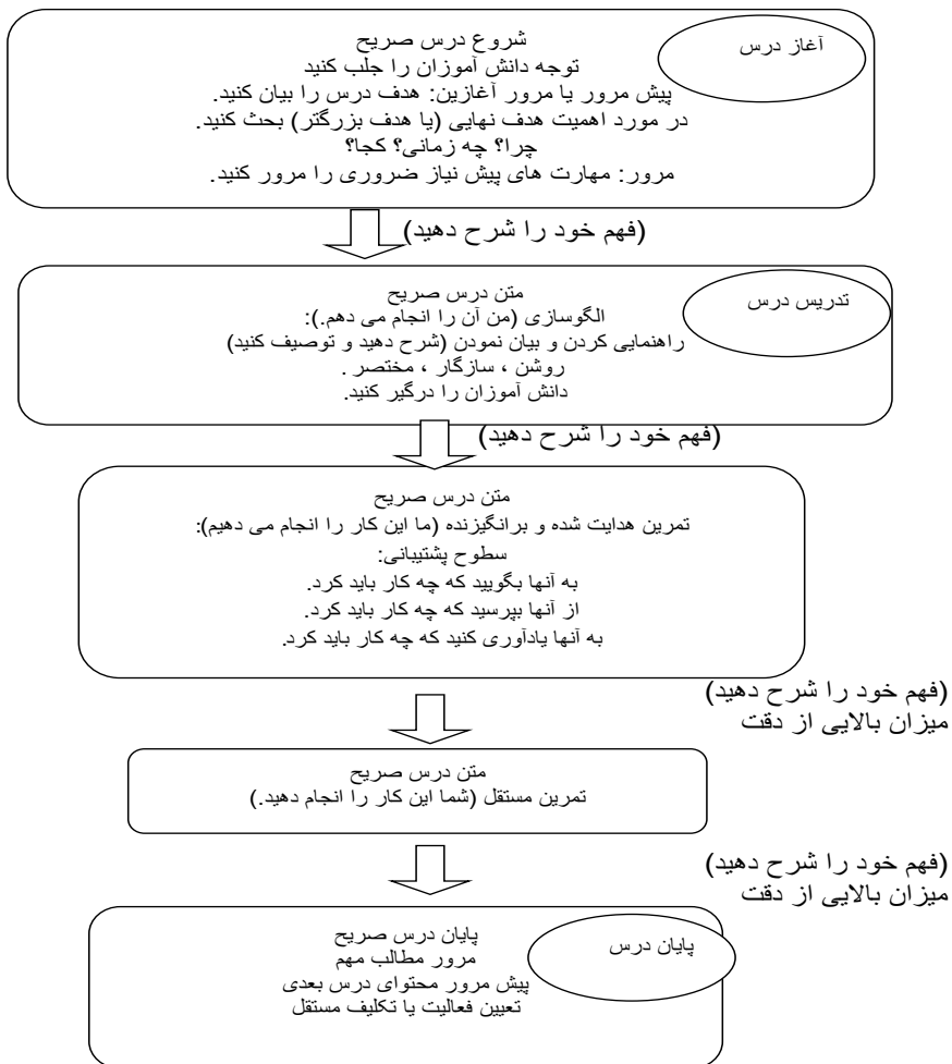
شکل ۲. ساختار درس صریح (Archer & Hughes, 2011)

در یک برداشت کلی و از کنار هم قرار دادن نقاط قوت و ضعف دو رویکرد صریح و خلاق از یک سو، و واقعیات حاصل از پژوهش های علمی و تجربه زیسته از سوی دیگر، می توان چنین بیان نمود که روند آموزش در کلاس درس مطالعات اجتماعی با شرایطی ناهماهنگ، تصادفی و پارادوکسیکال پیش می رود. این روند به گونه ای است که نه اصول برنامه درسی صریح به درستی اجرا می گردد و نه شرایط عینی و ذهنی برای اجرای برنامه درسی خلاق فراهم می باشد. همین امر کلاس درس مطالعات