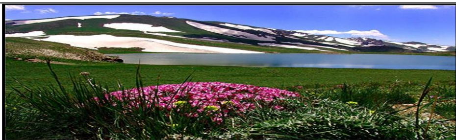
شکل شماره ۱: تصویری زیبا از دریاچه کوه دلامپر واقع در شهرستان ارومیه

همان طور که اشاره گردید، کاربرد عکاسی در علم جغرافیا بویژه در زمینه‌های آموزشی آن بسیار گسترده است؛ در ادامه به بیان نقش و تأثیر عکاسی در یکی از مهم‌ترین دروس جغرافیا یعنی روش تحقیق میدانی پرداخته می‌شود. استفاده از عکس و تصویر در درس روش و فنون میدانی در حوزه جغرافیا ابزاری بسیار مؤثر و کلیدی است که به دانشجویان این امکان را می‌دهد تا به طور مستقیم با مفاهیم و واقعیت‌های موجود در محیط‌های میدانی آشنا شوند و از تجربیات بصری بهره‌مند شوند. با استفاده از عکس و تصویر، دانشجویان قادرند به طور واقعی و دقیق منظره‌ها و محیط‌های زیست مورد مطالعه را ببینند. این امر به آن‌ها کمک می‌کند تا با ویژگی‌ها و جزئیات موجود در آن محیط‌ها، قبل از ورود به میدان، آشنا شوند و تحلیل‌های خود را با توجه به این دیدهای بصری انجام دهند. به طور کلی، استفاده از عکس و تصویر در درس روش و فنون میدانی جغرافیا، به دانشجویان کمک می‌کند تا به صورت مستقیم و با تجربه‌های بصری، با موضوعات جغرافیایی آشنا شوند و این امکان را داشته باشند که تجربیات خود را با تحلیل‌های عمیق‌تر و مفاهیمی که از مطالعه‌ی میدانی به دست می‌آورند، ترکیب کنند.