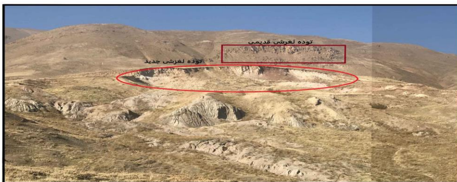
شکل شماره ۲: شناسایی ناپایداری‌های دامنه‌ای در مطالعات میدانی

همان طور که اشاره گردید، کاربرد عکاسی در علم جغرافیا بویژه در زمینه‌های آموزشی آن بسیار گسترده است؛ در ادامه به بیان نقش و تأثیر عکاسی در یکی از مهم‌ترین دروس جغرافیا یعنی روش تحقیق میدانی پرداخته می‌شود. استفاده از عکس و تصویر در درس روش و فنون میدانی در حوزه جغرافیا ابزاری بسیار مؤثر و کلیدی است که به دانشجویان این امکان را می‌دهد تا به طور مستقیم با مفاهیم و واقعیت‌های موجود در محیط‌های میدانی آشنا شوند و از تجربیات بصری بهره‌مند شوند. با استفاده از عکس و تصویر، دانشجویان قادرند به طور واقعی و دقیق منظره‌ها و محیط‌های زیست مورد مطالعه را ببینند. این امر به آن‌ها کمک می‌کند تا با ویژگی‌ها و جزئیات موجود در آن محیط‌ها، قبل از ورود به میدان، آشنا شوند و تحلیل‌های خود را با توجه به این دیدهای بصری انجام دهند. به طور کلی، استفاده از عکس و تصویر در درس روش و فنون میدانی جغرافیا، به دانشجویان کمک می‌کند تا به صورت مستقیم و با تجربه‌های بصری، با موضوعات جغرافیایی آشنا شوند و این امکان را داشته باشند که تجربیات خود را با تحلیل‌های عمیق‌تر و مفاهیمی که از مطالعه‌ی میدانی به دست می‌آورند، ترکیب کنند.